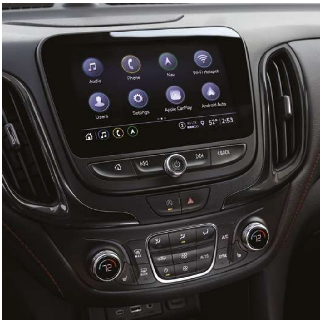
Apple Car Play қолдауы бар. Поддержка Apple Car Play.