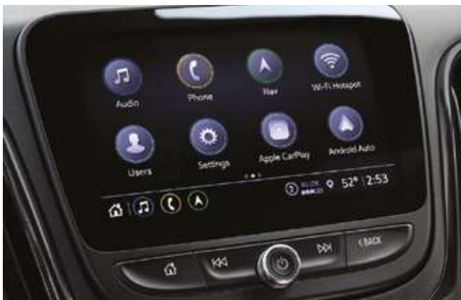
8" Chevrolet MyLink сенсорлық дисплейі. Сенсорный дисплей 8" Chevrolet MyLink.