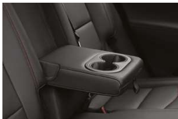
Орындықтардың, екінші қатарына арналған шыныаяқ қойғышы бар орталық шынтақ қойғыш. Центральный подлокотник с подстаканниками для второго ряда сидений.