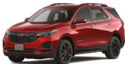
Қызыл / Красный.