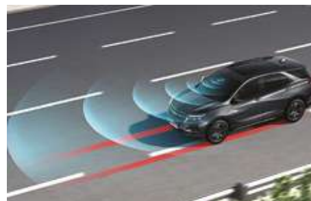
Қозталыс жолатынан шығу туралы ескерту жүйесі (LCA). Система предупреждения о сходе с полосы движения (LCA).