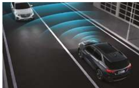
Фронтальды соқтығысу туралы ескерту жүйесі (FCW). Система предупреждения о фронтальном столкновении (FCW).