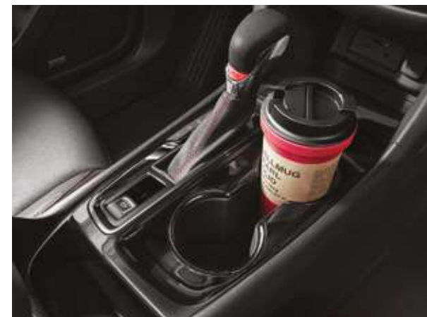
Орындықтардың бірінші қатарына арналған шыныаяқ қойғыштар. Подстаканники для первого ряда сидений.