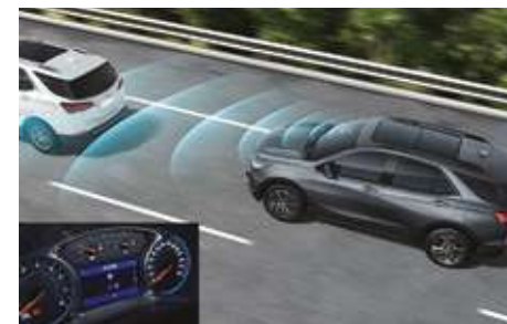
Автоматты төтенше тежеу жүйесі (АЕВ). Система автоматического экстренного торможения (АЕВ).