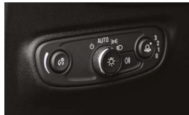
Фаралар параметрлері мен құралдар тақтасының жарықтытын басқару түймелері. Кнопки управления настроек фар и яркости панели приборов.