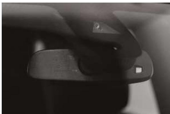
Қауіпсіздік жүйелерінің радары. Радар систем безопасности.