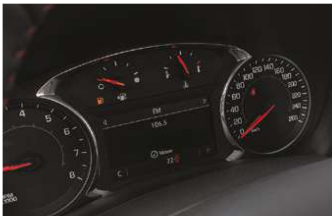
Жүргізушіге арналған ақпараттық дисплей. Информационный дисплей водителя.