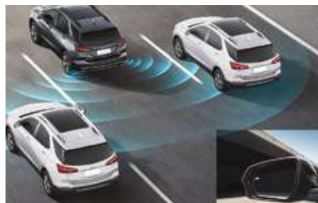
Бүйірлік көрінбейтін аймақтардағы кедергілер туралы ескерту жүйесі (SBZA). Система предупреждения о препятствиях в боковых мертвых зонах (SBZA).