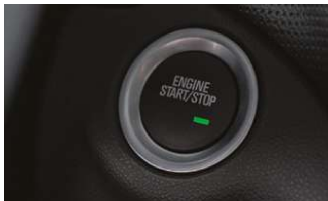
Қозғалтқышы кілтсіз іске қосылады. Бесключевой запуск двигателя.