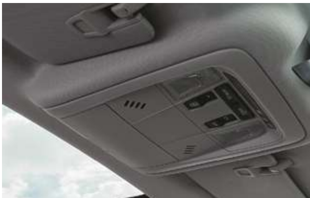
Панорамалық люкті басқару блогы. Блок управления панорамным люком.