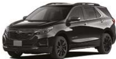
Қара / Черный.