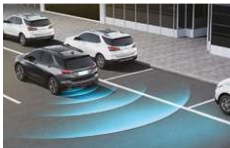
Артқы тұрақ датчиктері. Задние датчики парковки.