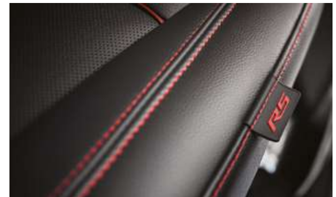
Орындықтары стильді түрде қайып тігілген. Стильная прострочка сидений.

*Ескерту: Осы каталогта сипатталған автомобильдердің сипаттамалары мен жабдықтары модельдер мен конфигурацияларға байланысты өзгеруі мүмкін.