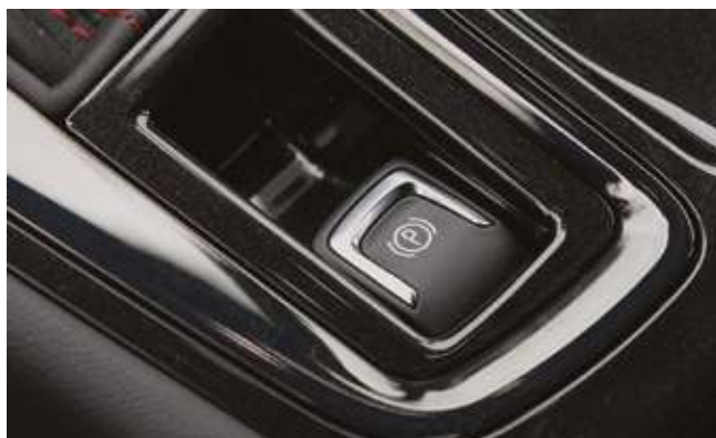
Электрондық тұрақ тежегіші. Электронный стояночный тормоз.