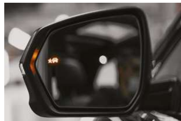
Бүйірлік соқыр аймақтар туралы ескерту сигналы. Сигнал предупреждения о боковых слепых зонах.

*Ескерту: Осы каталогта сипатталған автомобильдердің сипаттамалары мен жабдықтары модельдер мен конфигурацияларға байланысты өзгеруі мүмкін.