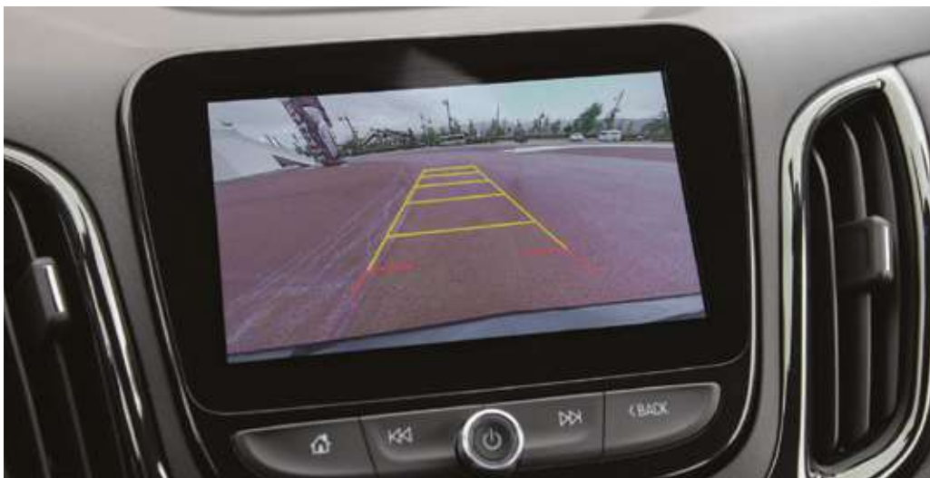
Динамикалық бөлінісі бар артқы көрініс камерасының проекциялық дисплейі. Дисплей проекции камеры заднего вида с динамической разметкой.