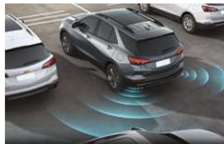
Артқы қозғалыс кезінде көрінбейтін аймақтарды басқару жүйесі (RCTA). Система контроля мертвых зон при движении задним ходом (RCTA).