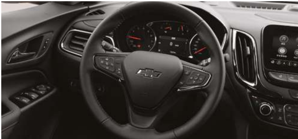
Мультифункционалы былғарымен қапталған руль. Мультифункциональное кожаное рулевое колесо.