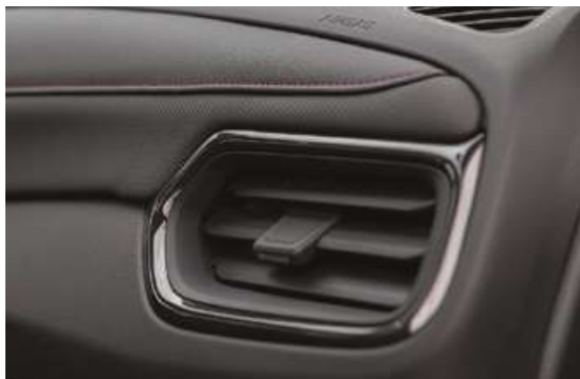
2 аймақтық климатты бақылау. 2-х зонный климат контроль.