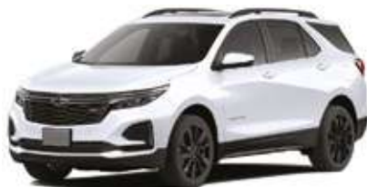
Сұрғылттау ақ / Дымчато-белый.