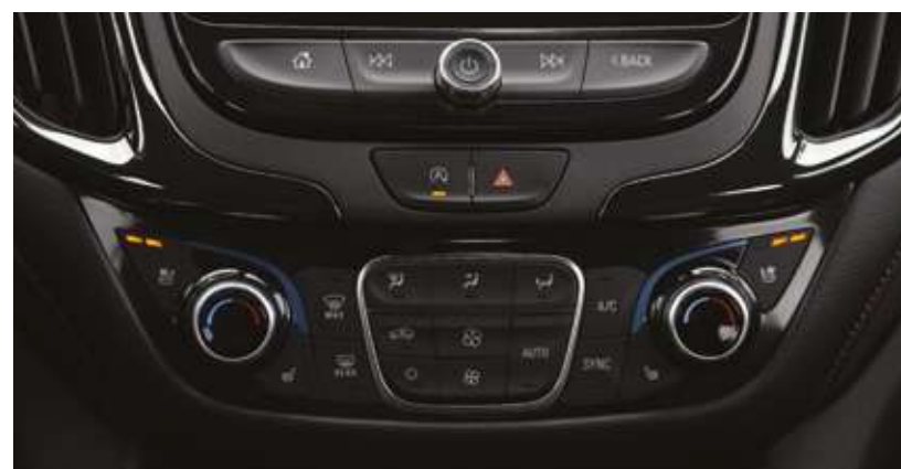
Климатты басқару модулі. Модуль управления климатом.

*Ескерту: Осы каталогта сипатталған автомобильдердің сипаттамалары мен жабдықтары модельдер мен конфигурацияларға байланысты өзгеруі мүмкін.