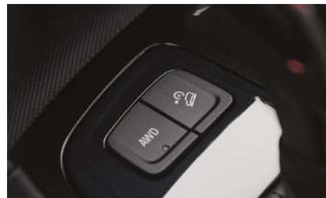
Толық жетектің жұмыс режимін ауыстыру селекторы. Селектор переключения режима работы полного привода.

*Ескерту: Осы каталогта сипатталған автомобильдердің сипаттамалары мен жабдықтары модельдер мен конфигурацияларға байланысты өзгеруі мүмкін.