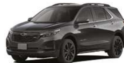
Сұр / Серый.