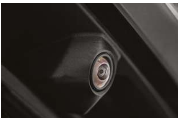
Артқы көрініс камерасы. Камера заднего вида.