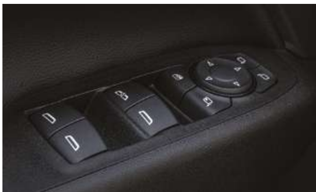
Электрлі терезе көтергіштер. Электрические стеклоподъемники.