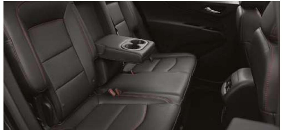
Ортасында шынтақ қойғышы бар екінші қатардағы жайлы диван. Комфортный диван для второго ряда, с центральным подлокотником.