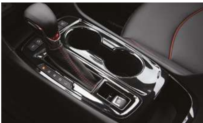
9 сатылы автоматты беріліс қорабы. 9-ступенчатая автоматическая коробка передач.