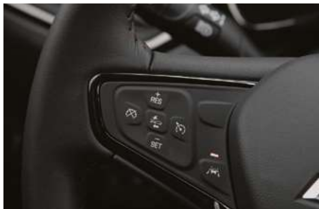
Адаптивті круиздік бақылауды іске қосу кнопкалары және жолақтан шығу туралы ескерту жүйесі. Кнопки активации адаптивного круиз-контроля и системы предупреждения о сходе с полосы.