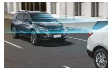
Қысқа қашықтықта қауіпті ескертегін жүйе. Система предупреждения об опасно малой дистанции.