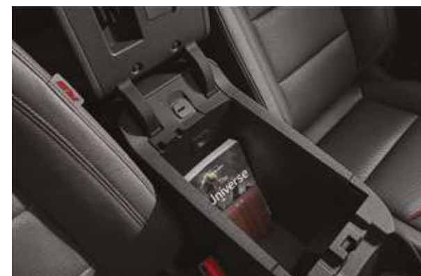
Бірінші қатардағы орталық шынтақ қойғыш астында жарықтандырылған кең қорап орналасқан. Вместительный бокс с подсветкой под центральным подлокотником первого ряда.

*Ескерту: Осы каталогта сипатталған автомобильдердің сипаттамалары мен жабдықтары модельдер мен конфигурацияларға байланысты өзгеруі мүмкін.