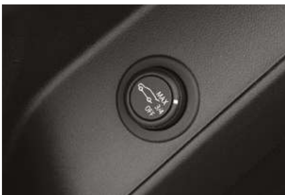
Биіктігі реттелетін жүк салғыш есігінің электр жетегі. Электропривод двери багажника с регулировкой по высоте.