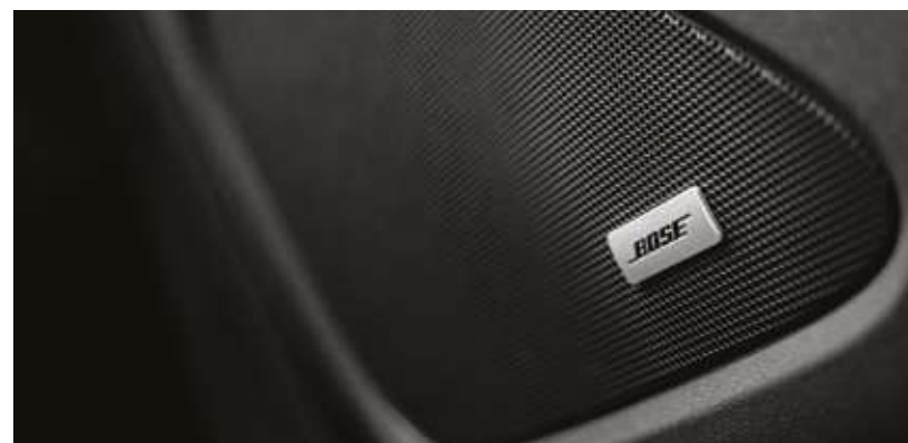
Күшейткіші және 7 динамигі бар Bose премиум акустикалық жүйесі. Акустическая система премиум класса Bose с усилителем и 7 динамиками.