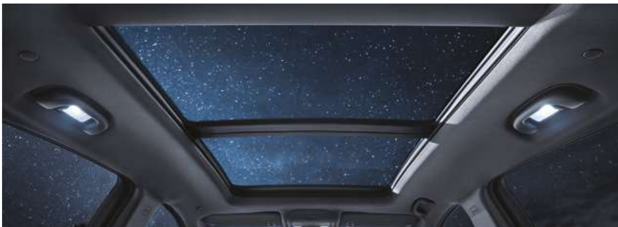
Электр жетегі бар кең панорамалық люк. Просторный панорамный люк с электроприводом.