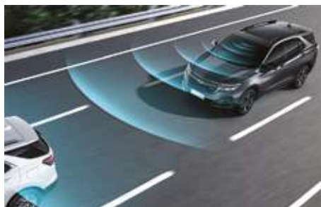
Бөйімделгіш круиз-бақылау. Адаптивный круиз-контроль.