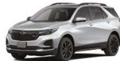
Болат түстес сұр / Стальной-серый.