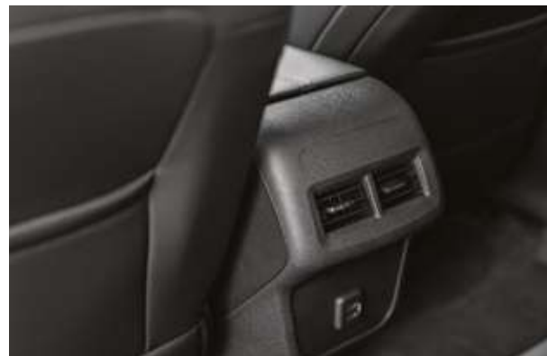
Екінші қатардағы жолаушыларды жылытатын ауа айдағыштар. Воздуховоды для обогрева пассажиров второго ряда сидений.