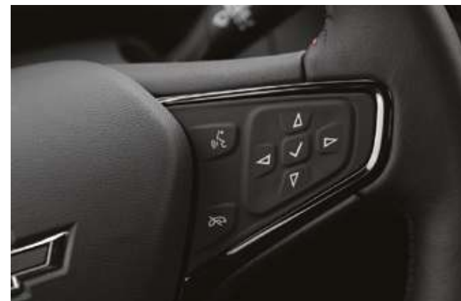
Құралдар тақтасы мәзірінің басқару кнопкалары. Кнопки управления меню панели приборов.