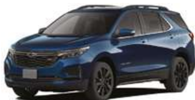
Көк / Синий.